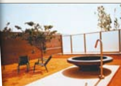
◀ Patio central