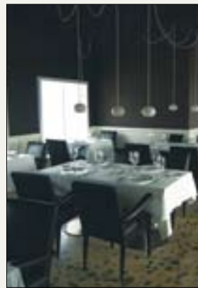
Los distintos tonos de gris mandan en el restaurante.

Creativa y de temporada. Así se define la cocina del restaurante del hotel Aire de Bardenas. Las hortalizas y verduras de la huerta de la Ribera de Navarra proporcionan la frescura y la calidad a los platos que se elaboran en este hotel. El establecimiento dispone de un huerto propio con el que se abastece de alcachofas, espárragos y cogollos, entre otros productos, según la temporada. El hotel, además, cuenta con dos salones de gran capacidad.