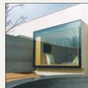
▲ Vista exterior

► Teléfono: 94 811 66 66 Fax: 948 116 348